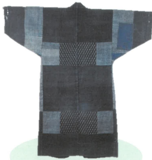
裂織の仕事着[サグリ]