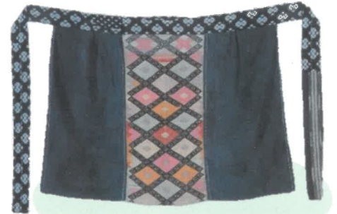
南部菱刺し[前だれ]