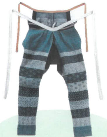
南部菱刺し[たっつけ]