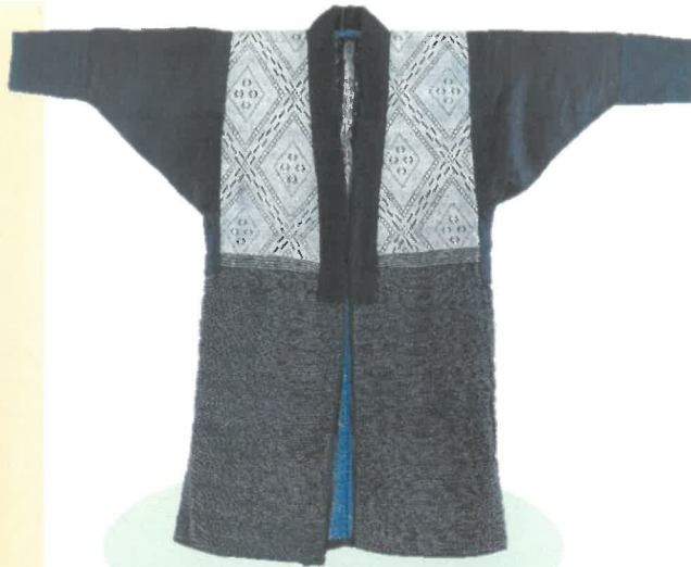
津軽こぎん刺し着物